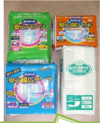
介護用品給付券対象商品