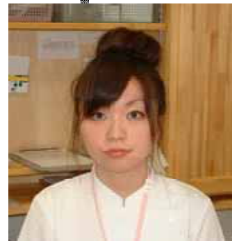
あじさい薬局 事務

今、全国の被爆者の数は26万人とされています。しかし国の始めた戦争がもたらした原爆被害であったにもかかわらず、国は国家補償を拒否しています。