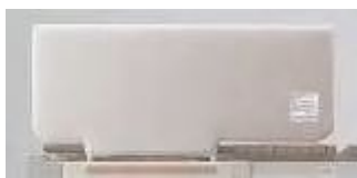
(サイドレールカバー)

などを使って隙間を埋めています。利用者さんの身体状況やベッドの状況、住環境などに応じて家にあるもので行えます。また、各ベッドメーカーから対応製品や対応付属品が発売、無償配布されています。