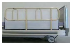
(隙間を塞ぐカバー)